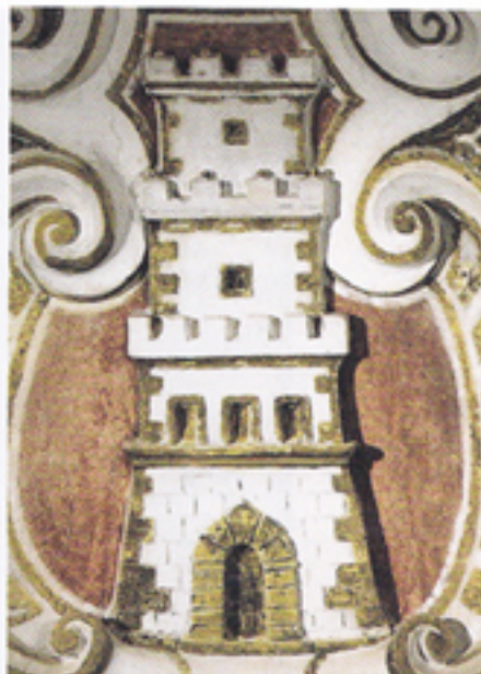
Fig. 73. Sipicciano, Chiesa S. Maria Assunta in Cielo, Cappella Baglioni, stemma Baglioni (fine sec. XVI)

Steuano Capitano Simonetto ducastello depere. Conducente capitano diomally apido de nro. S. z delanta chila / de gmo. dello R. p. S. cardinal legato / I parte de sy soldy receppe dalla comunita de horueto xentp de den' delfale ducaty. ducam mille cento z ventiduy zho xx / de qualy ady xvj de jorajo 1439 inroma / dnglo mpo maria suo conselle z papeatore in uice et nome del ofato Simonetto ducastello z fine zc. sicome appax pman de s. pax. lin uoy. a lito C 20 1122 620