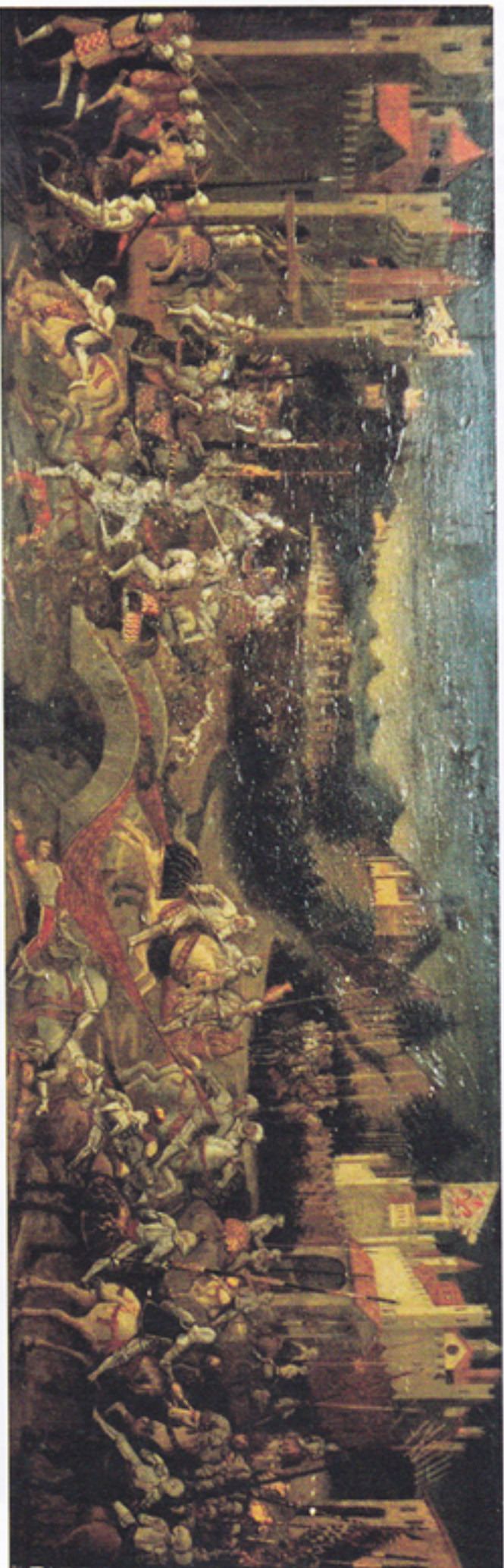
Fig. 77. Madrid, Museo Arqueológico Nacional, Cassone nuziale con la raffigurazione della battaglia di Anghiari (inv. n. 51936, dim. 106 x 218 cm.), fattura fiorentina, 1450 ca. (tratto da M. PREDONZANI, Anghiari 29 giugno 1440. La battaglia, l'iconografia, le compagnie di ventura, l'araldica, Città di Castello [Perugia] 2010 , tav. 3)