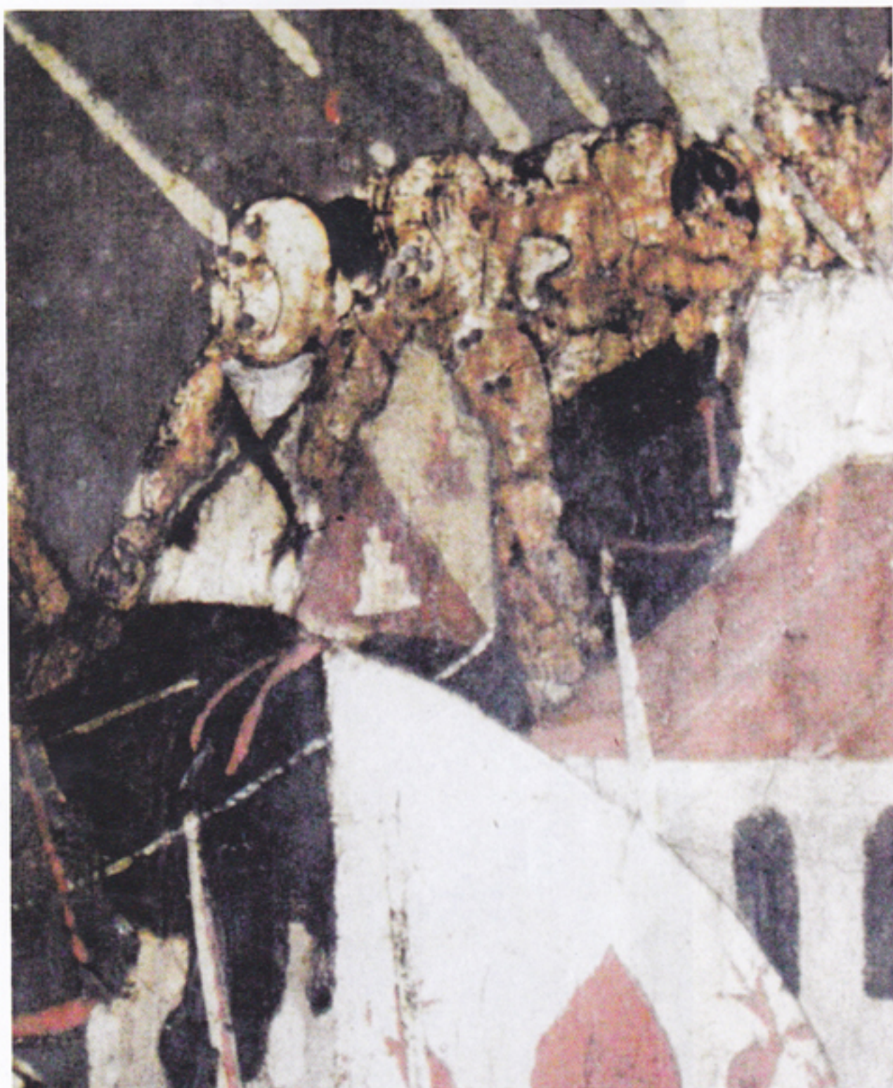
Fig. 78. Dublino, National Gallery of Ireland, Cassone nuziale con la raffigurazione della battaglia di Anghiari (cat. n. 778, dim. 61 x 205 cm.), attribuito alla bottega di Apollonio di Giovanni di Firenze, 1450 ca. (tratto da M. PREDONZANI, Anghiari 29 giugno 1440. La battaglia, l'iconografia, le compagnie di ventura, l'araldica , Città di Castello [Perugia] 2010, tav. 2), particolare dell'area destra superiore. L'ingrandimento evidenzia la raffigurazione, a cavallo, del capitano Simonetto, sulla cui giornea è visibile la torre a tre palchi distintiva della famiglia Baglioni di Castel di Piero (torre bianca su campo rosso in basso e torre rossa su campo bianco in alto)