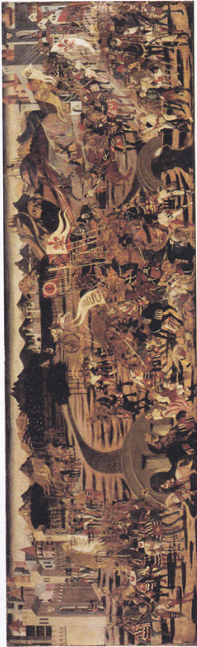
Fig. 76. Dublino, National Gallery of Ireland, Cassone nuziale con la raffigurazione della battaglia di Anghiari (cat. n. 778, dim. 61 x 205 cm.), attribuito alla bottega di Apollonio di Giovanni di Firenze, 1450 ca. (tratto da M. PREDONZANI, Anghiari 29 giugno 1440. La battaglia, l'iconografia, le compagnie di ventura, l'araldica , Città di Castello [Perugia] 2010, tav. 2)